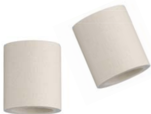
サイレントフィルタ抗菌プラス