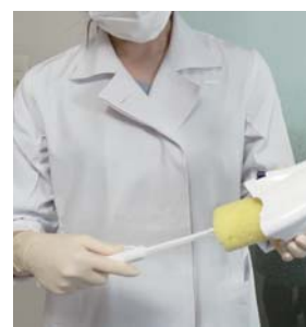
内部はスポンジで