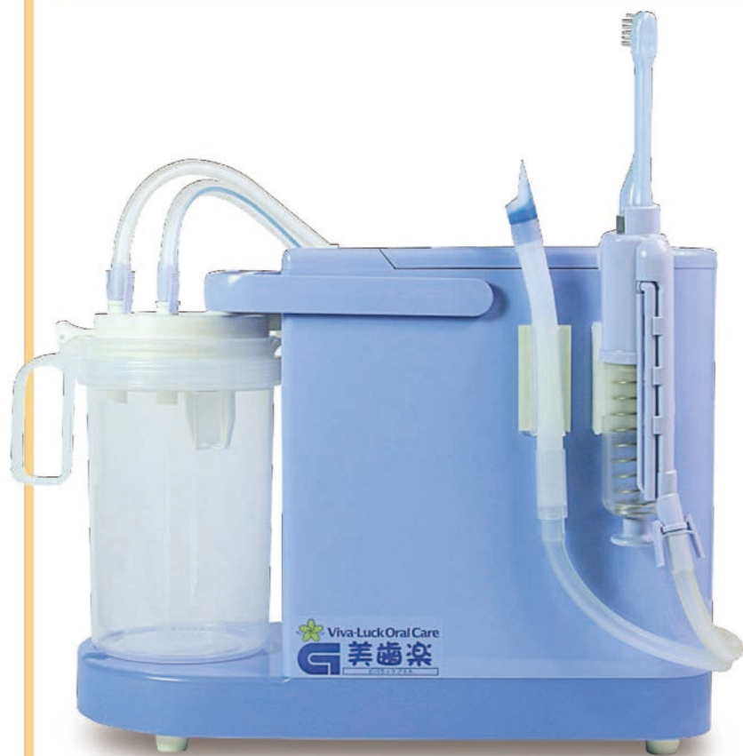
※此照片是《Viva-Luck PLUS（基本设备）》和注水·吸引牙刷设备。