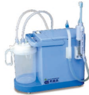
注水·吸引牙刷套装 / 安装例图

尺寸: W150xD320xH246.5mm < 基本套装内容 > 电源: 单相100V 本体, 水分离机 (约800ml), 电流: 4.0A 吸引器hold, 吸引器, 功率: 0.50kW 吸引器专用管, 笔灯, 清扫用刷 重量: 约3.0kg 产品编号: E560