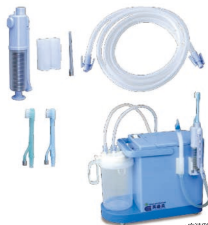
注水·吸引牙刷套装

牙科专用吸引头，可以轻松吸引大块污物和大量的水。而且通过恰当使用《注水·吸引牙刷套装》和《吸引牙刷套装》，可以提供更有效率的口腔护理服务。