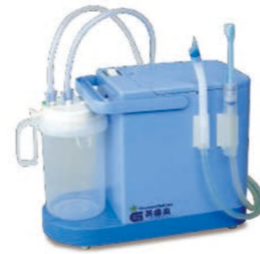
吸引牙刷套装 / 安装例图