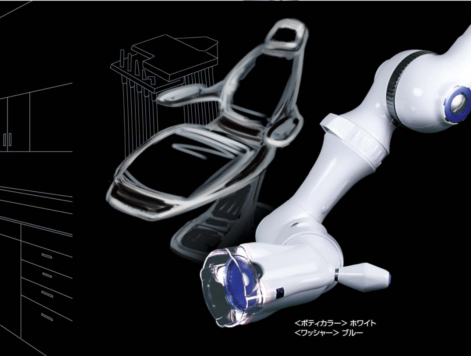
<ボディカラー> ホワイト <ワッシャー> ブルー

滑らかなフォルムからは どこか温かみをも感じられ 息づかいさえ聞こえてくるよう。 その外観からは想像もつかない ほどのパワーを秘めている。 操る喜びが今ここに。