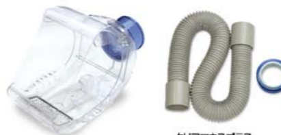
クリアマウスプラス クリアマウスプラス 技工用アタッチメントセット

アルテオLフード 寸法: φ117×D194mm B458 / 04560200857904